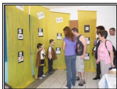
Jardim Manhã - 10 mandamentos do Trânsito Seguro