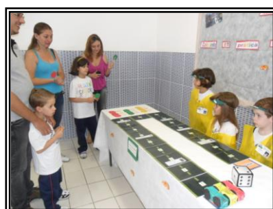
Jardim III - Jogo Test Drive