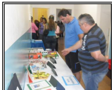
Exposição de Atividades