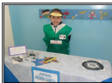
Jardim II - Viaje em Segurança