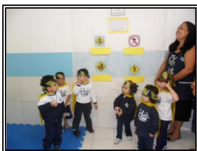
Mini Jardim - Super Pedestres