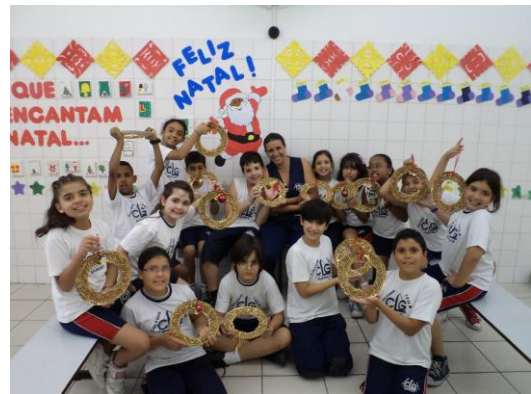
Turma do 4º ano B com suas guirlandas, abaixo ensaiando as cantigas.