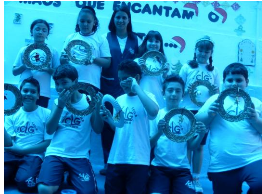
Turma do 4º ano A e suas guirlandas.

Fizeram lindas guirlandas e ensaiaram cantigas natalinas tradicionais tornando esse momento de finalização do ano letivo ainda mais gostoso e mágico.