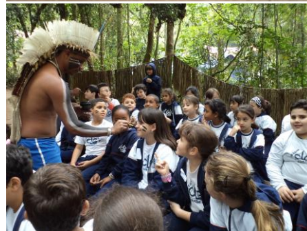
Conhecendo mais sobre a Cultura Indígena