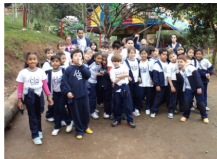
Grupo de alunos do 2º ano