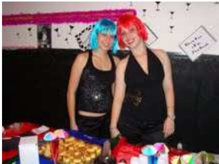
3ºEM – Tim Maia A Disco Nigth agitou a apresentação com as músicas e receitas preferidas do Tim.

Estamos orgulhosos do empenho e competência demonstrados por nossos alunos e professores... Parabéns a todos!