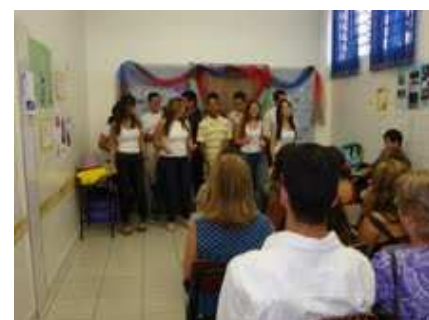
1ºEM – Renato Russo Musical homenageando as principais canções do compositor.