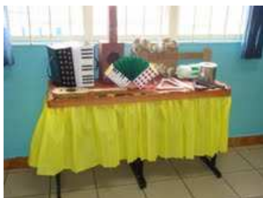
7ºano A e B – Luiz Gonzaga Instrumentos Musicais de sucata confeccionados pelos alunos para homenagear o Rei do Baião