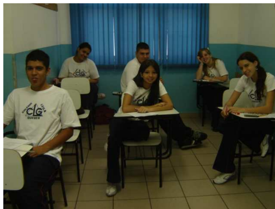
Formandos 3ºano Ensino Médio