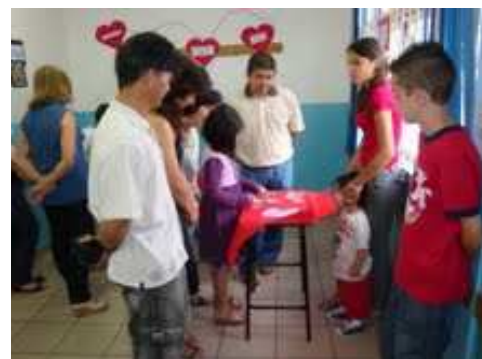
8ºano – Pixinguinha Visitantes montando o quebra-cabeça com a caricatura do compositor.