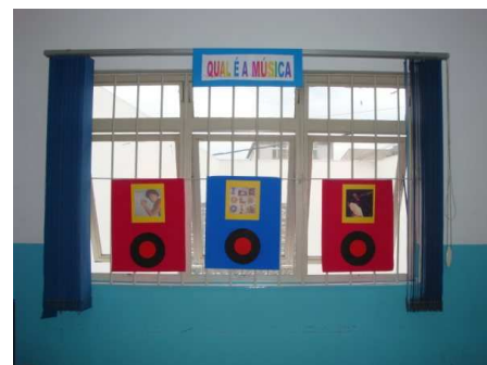
9ºano – Cazuzza Jogo do “Qual é a música?” proporcionou ao visitante conhecer mais sobre as músicas e discos do compositor.