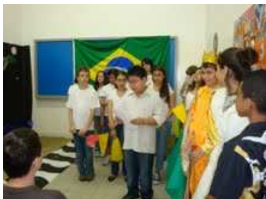
6ºano A e B – Ary Barroso Coral – Aquarela do Brasil

No dia 28/11 aconteceu a apresentação final do Projeto Grandes Compositores Brasileiros. Foi um momento muito especial para alunos e professores, onde os visitantes puderam prestigiar o trabalho de um ano inteiro. Acompanhe agora um pouco das apresentações!