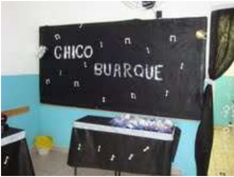
2ºEM – Chico Buarque Festivais e ditadura foram os temas abordados pela turma.