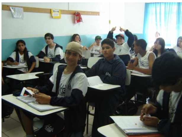
Formandos 9ºano – Fundamental II

Lembrem-se: tracem seus objetivos e dediquem-se!