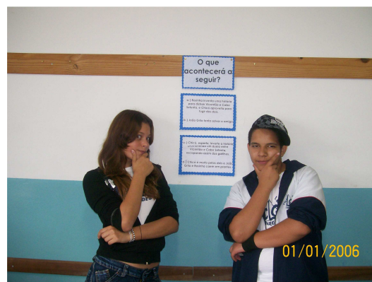
8º ano – Ariano Suassuna