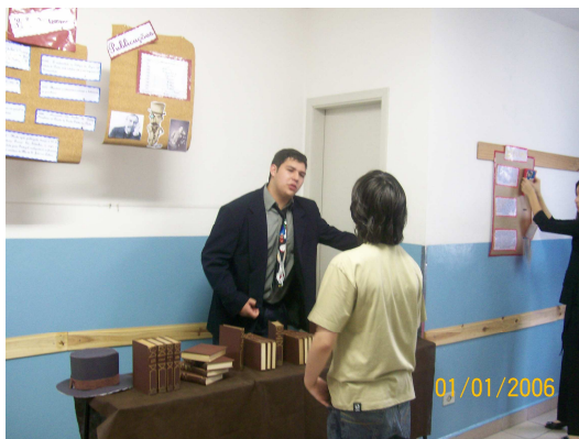
2º Ensino Médio – Eça de Queiroz