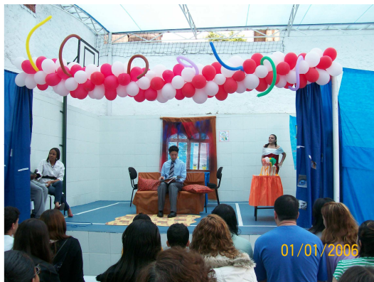
1º Ensino Médio – Machado de Assis