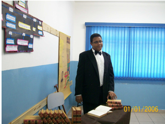
9º ano – José de Alencar